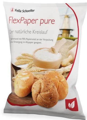
Bildtitel 1: Maßgeschneiderte Papierverbundlösungen